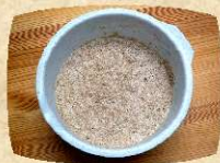
Bläschenbildung beim gehenden Teig

Wir werden im Seminar mit natürlichen Zutaten ein qualitativ hochwertiges Brot backen. Als sanftes Triebmittel wird Backferment zugesetzt. Dieses Brot ist daher sehr mild im Geschmack und besonders leicht verdaulich. Wegen des Verzichts auf Hefe ist das Brot auch für Menschen mit Hefeunverträglichkeit geeignet.