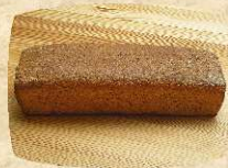
Das fertiggebackene Brot hat eine goldbraune Farbe.

Zwischendurch während der Brotteig ruht, werden wir uns mit den kulturellen Hintergründen zur Kunst des Brotbackens bekannt machen und das Getreide und seine Wirkung auf den Menschen erforschen.